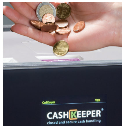
Accepte, valide, recycle et paie toutes les pièces