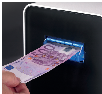
Accepte et vérifie tous les billets, compris de 500 €