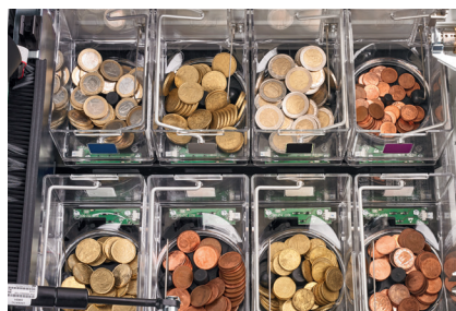
Chaque pièce a son propre hopper. Fiabilité et rapidité optimales