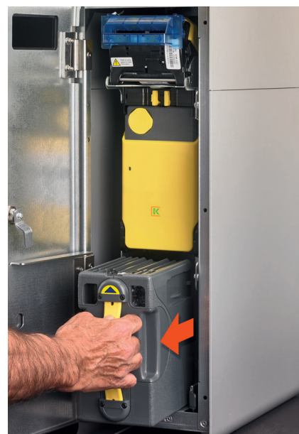
Collecte de billets dans un module fermé. Personne ne voit ni touche l'argent